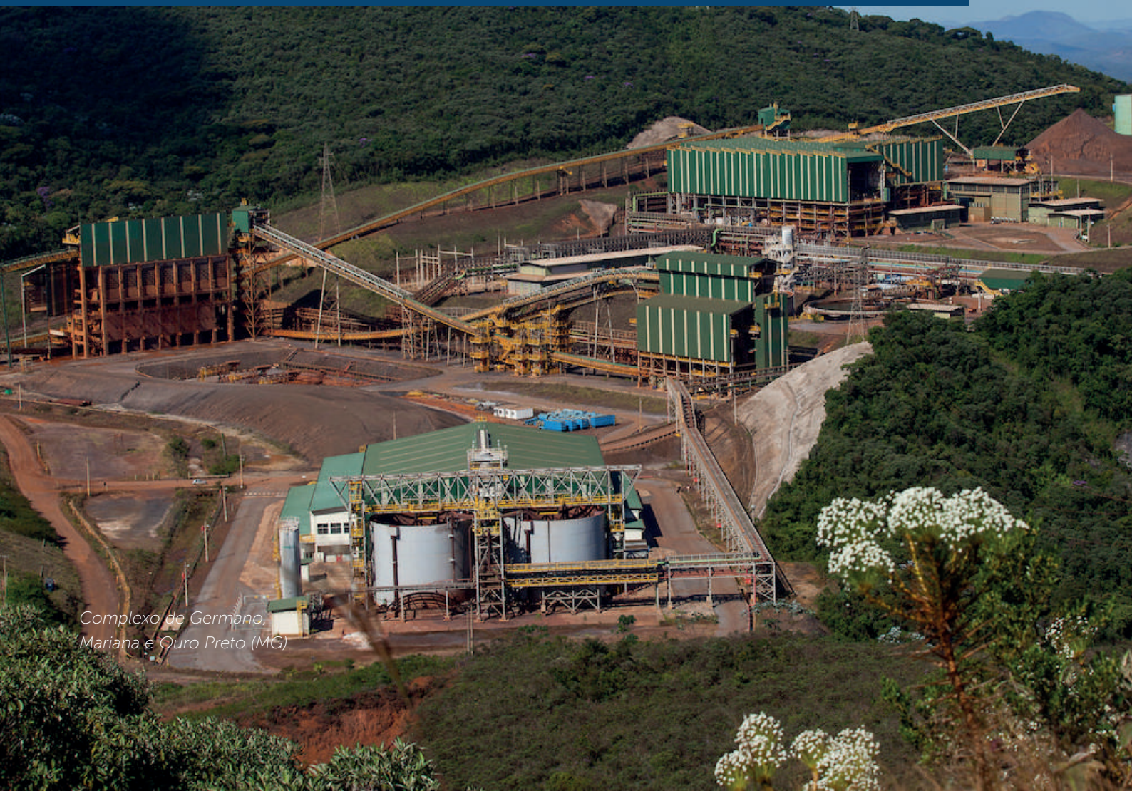
Complexo de Germano, Mariana e Ouro Preto (MG)