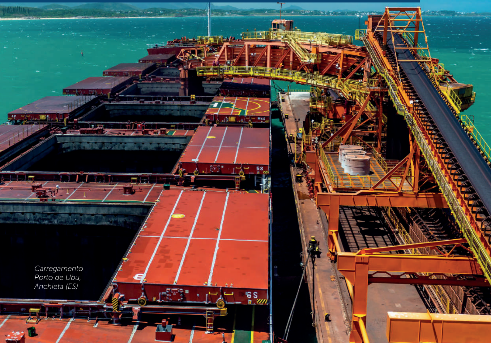
Carregamento Porto de Ubu, Anchieta (ES)